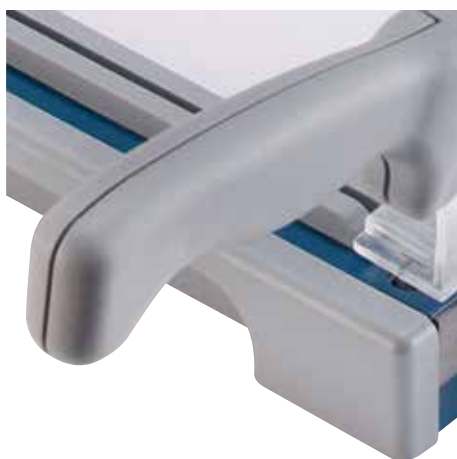
Ergonomiczny kształt uchwytu zapobiega męczonieniu się rąk w trakcie cięcia